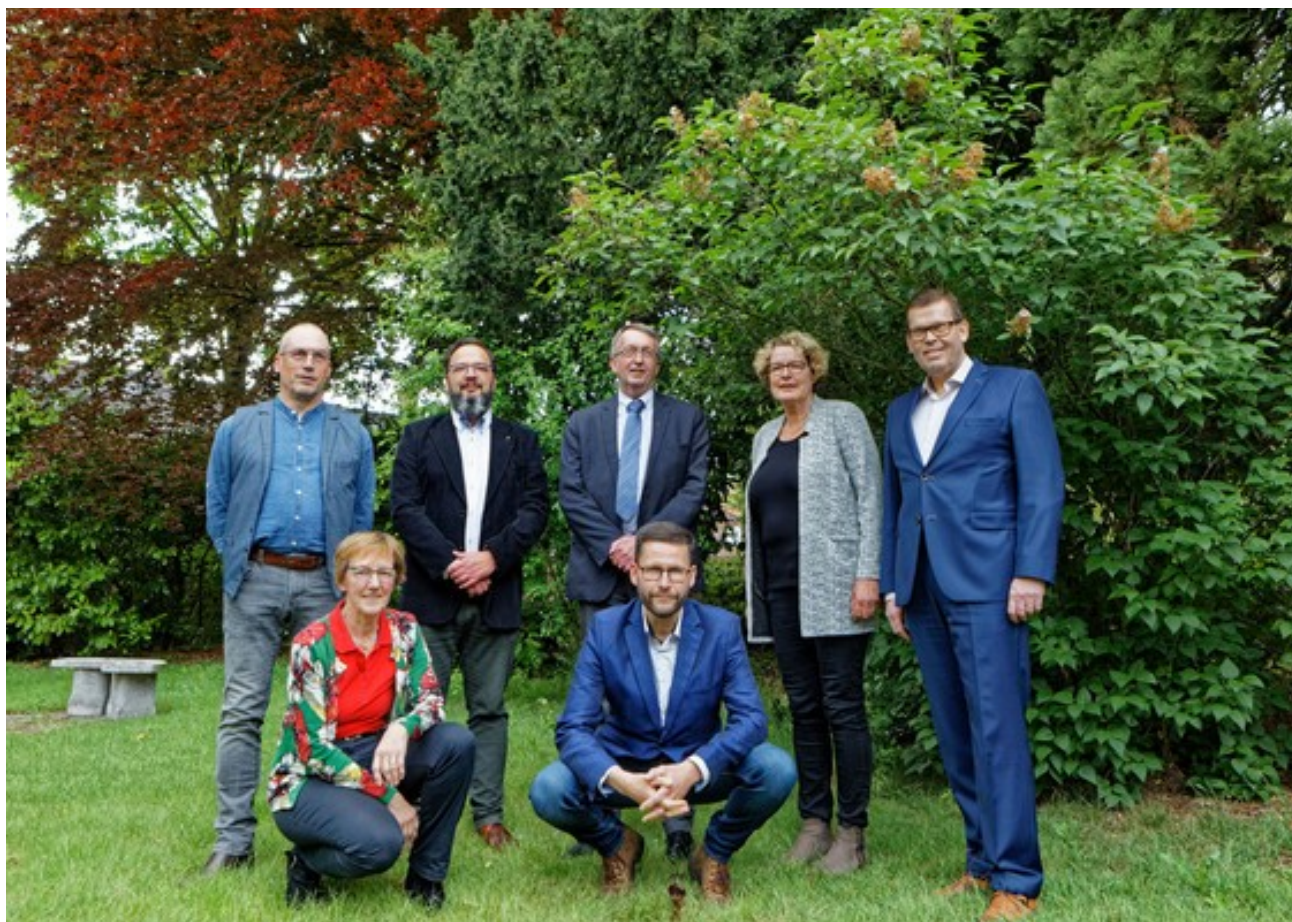
Foto: Parochiebestuur Sint Jan de Doper - 1 januari 2020.